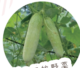
村の伝統野菜高山きゅうり