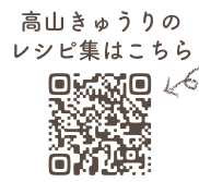
高山きゅうりのレシピ集はこちら