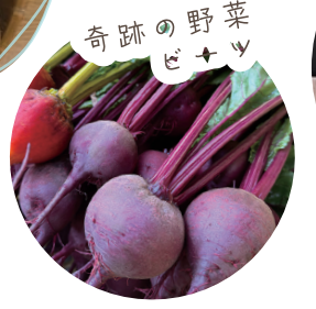
奇跡の野菜ビーツ