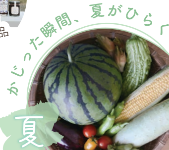
かじった瞬間、夏がひら