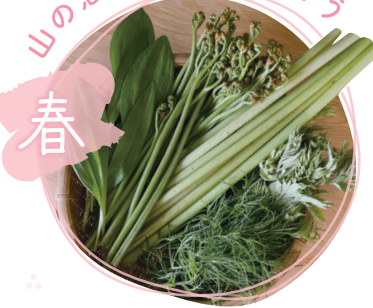
山の恵。芽吹のごちそう