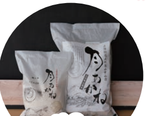
高山村のブランド米「月あかね」