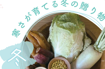
熊が育てる冬の贈り物