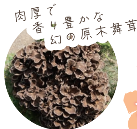
肉厚で香り豊かな原木舞茸