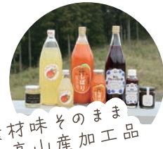
素材味そのまま高山産加工品