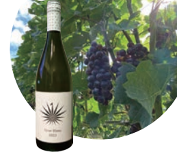
自然と共につくる十千マラルワイン