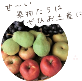
甘い果物たちはぜひお土産に