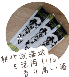
耕作放棄地を活用した香り高い蕎麦