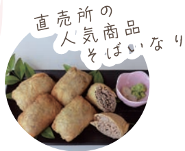
直売所の人気商品とばいなり