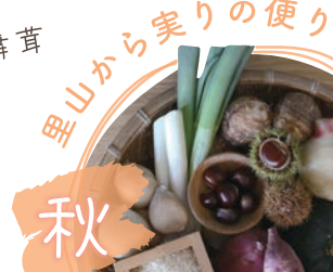
里山から実りの便り